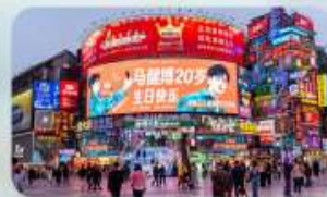
ถนนคนเดินหวงซิงอู่