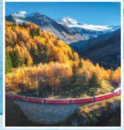
BERNINA EXPRESS Unesco