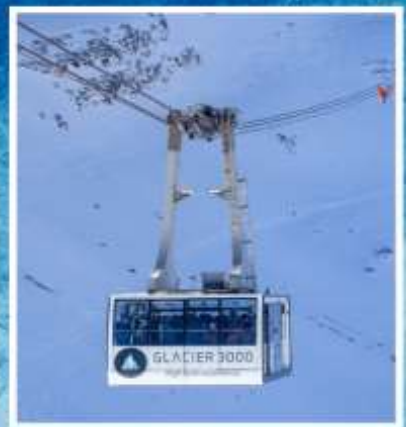
GLACIER3000 Peak walk by Tissot