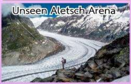
Unseen Aletsch Arena

ชมความงดงามของทะเลสาบเจนีวา ชมปราสาทชิลองที่เมืองมองค์เทรอร์ช ล่องเรือชมความงามของทะเลสาบ ลูเซิร์น, พักในหมู่บ้านเซอร์แมท (เมืองตากอากาศปลอดมลพิษ ที่ได้ชื่อว่าสวยงามเหมือนสวรรค์บนดิน)