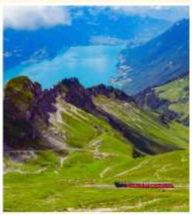
BRIENZER ROTHORN Sorenberg Schonenboden