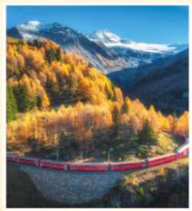
BERNINA EXPRESS Unesco