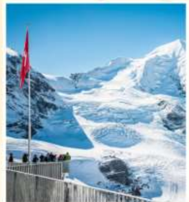
DIAVOLEZZA Piz bernina Peak