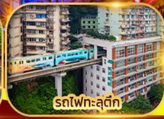
รถไฟฟ้าฉู่ตึก