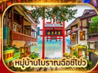
หมู่บ้านโบราณฉือชิว