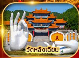
วัดหลิงเจียน