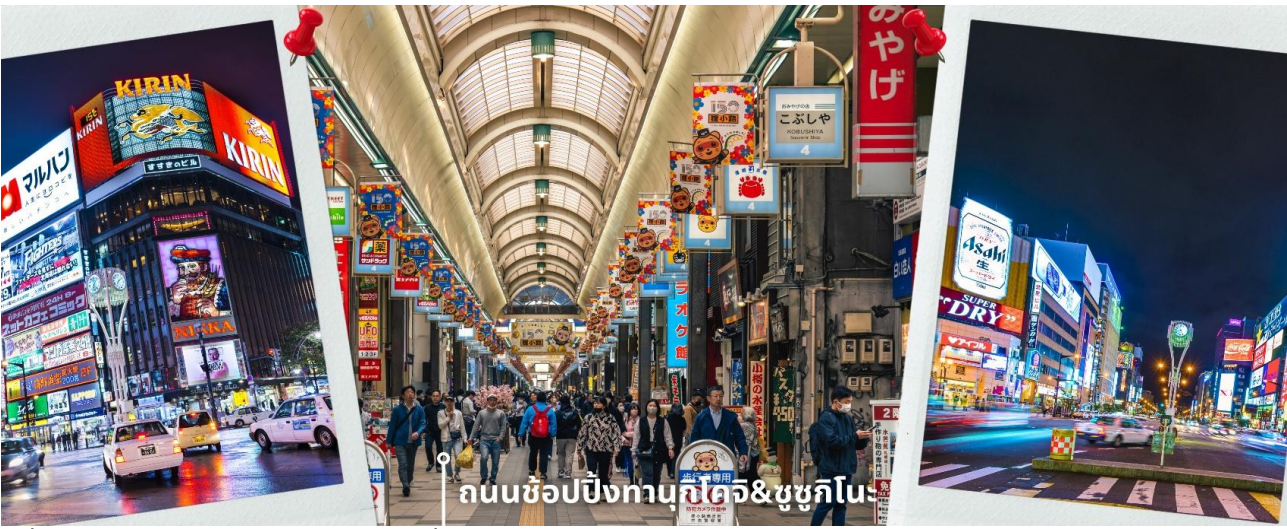
ถนนช้อปปิ้งทานุกิโคจิ&ชูซุกิโนะ

นอกจากนี้ด้านในยังมีช่วงที่ เปิดโอกาสให้ผู้เยี่ยมชมสามารถทำกล่องดนตรีของตัวเองได้ ทั้งเลือกรูปแบบและการเลือกเมโลดี้เพลง เพื่อสร้างผลงานของตัวเองที่มีขึ้นเดียวในโลก และยังมีร้านค้าสำหรับขายกล่องดนตรีเพื่อซื้อเป็นของฝาก ของที่ระลึกได้อีกด้วย พอสมควรแก่เวลานำท่านเดินทางสู่ ถนนช้อปปิ้งทานุกิโคจิ เป็นถนนช้อปปิ้งที่ตั้งอยู่แทบจะใจกลางเมือง Sapporo โดยมีร้านค้า ร้านอาหาร ห้างสรรพสินค้า ร้านเกม และโรงแรม รวมกันมากกว่า 200 เรียงรายยาวตั้งแต่ทิศตะวันตก ยันทิศตะวันออกยาวถึง 1 กิโลเมตร และยังมีบันไดเลื่อนลงไปทางเดินใต้ดินอีกด้วย ซึ่งทางเดินใต้ดินก็ยังมีร้านค้า ร้านอาหารอีกมากมายด้วยเช่นกัน ถนนช้อปปิ้งแห่งนี้เป็นที่ที่มีหลังคาแทบจะตลอดทาง ดังนั้นแล้วไม่ว่าจะฝนตก หิมะตก หรือแดดแรง ก็ยังสามารถเดินช้อปปิ้งที่ถนนแห่งนี้ได้เหมือนเดิม และย่านชูซุกิโนะ เป็นย่านช้อปปิ้งและบันเทิงใหญ่ที่สุดในซัปโปโร ตั้งอยู่ใจกลางเมืองและตั้งอยู่บริเวณรอบๆสถานีรถไฟใต้ดินชูซุกิโนะ อยู่ถัดไปไม่กี่ไกลจากสวนสาธารณะโอโดริประมาณ 500เมตรและอยู่ไม่กี่ไกลจากถนนทานุกิโคจิ ย่านนี้เป็นที่นิยมของทั้งคนท้องถิ่นและนักท่องเที่ยว ย่านนี้เต็มไปด้วยร้านค้ามากมาย ทั้งสินค้าแฟชั่น สินค้าแบรนด์เนมของฝาก ของที่ระลึก และสินค้าอุปโภคบริโภคต่างๆ รวมถึงสถานบันเทิงยามค่ำคืน ให้เวลาท่านได้อิสระเดินช้อปปิ้ง