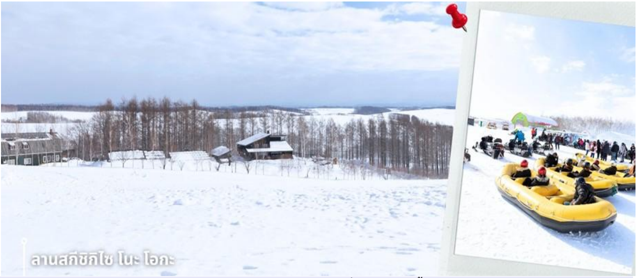
** การตกและความหนาวของหิมะในการเล่นกิจกรรมที่ลานสกีได้จะขึ้นอยู่กับสภาพอากาศ **

เช้า รับประทานอาหารเช้าที่ โรงแรม (3) หลังรับประทานอาหารเช้า นำท่านเดินทางสู่ ลานสกีสวนชิโกชิ โนะ โอะกะ (ไม่รวมค่าชุดและค่าอุปกรณ์เล่นกิจกรรม) ในช่วงฤดูหนาว ตั้งแต่ปลายเดือนธันวาคมถึงกลางเดือนมีนาคม ชิโกชิโนะโอะกะในเมืองบิเอะ พื้นที่กว่า 15 เฮกตาร์ หรือประมาณ 93 ไร่ เป็นสถานที่ที่ได้ชื่อว่า มีความสวยงามทั้ง 4 ฤดู จะเปลี่ยนเป็นลานหิมะที่เต็มไปด้วยกิจกรรมฤดูหนาวสำหรับทุกวัย นักท่องเที่ยวสามารถเพลิดเพลินกับการนั่งสโนว์ราฟต์ ที่ลัดเลาะไปตามเนินหิมะ กิจกรรมขับ สโนว์โมบิลสุดเร้าใจ หรือจะเล่นเลื่อนหิมะและปั้นตุ๊กตาหิมะ ท่ามกลางทัศนียภาพชาวโพลนของเมืองบิเอะ พร้อมชมวิวกุเอาที่สวยงามตระหง่านอยู่เบื้องหลัง