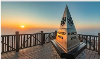
ฟานซิปิน