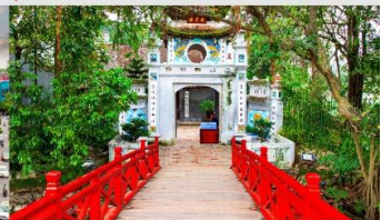
วัดห่งอกเซิน

*ทางบริษัทฯ ขอสงวนสิทธิ์ในการสลับโปรแกรมทัวร์ตามความเหมาะสมขึ้นอยู่กับสถานการณ์หน้างาน โดยคำนึงถึงผลประโยชน์ของลูกค้าเป็นสำคัญ