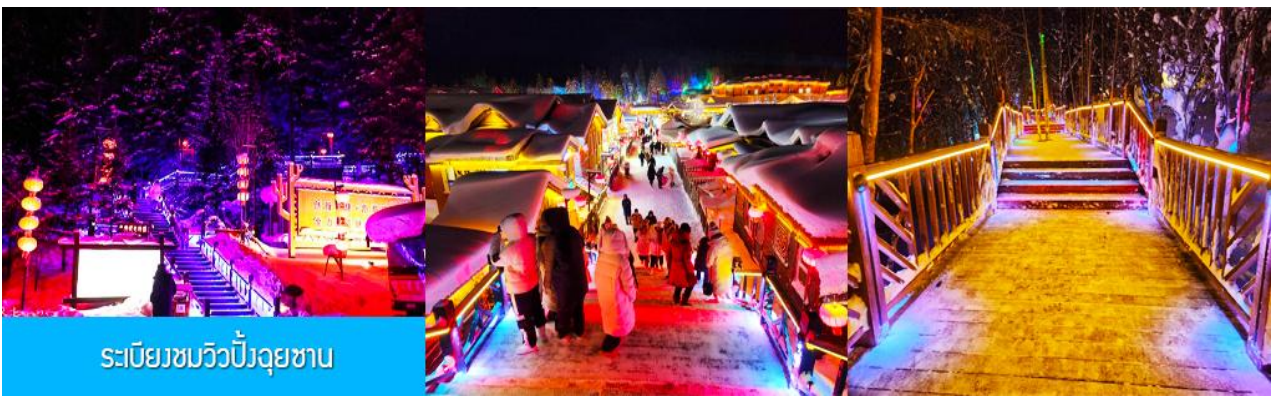
ระเบียงชมวิวยิ่งจฺยชาน