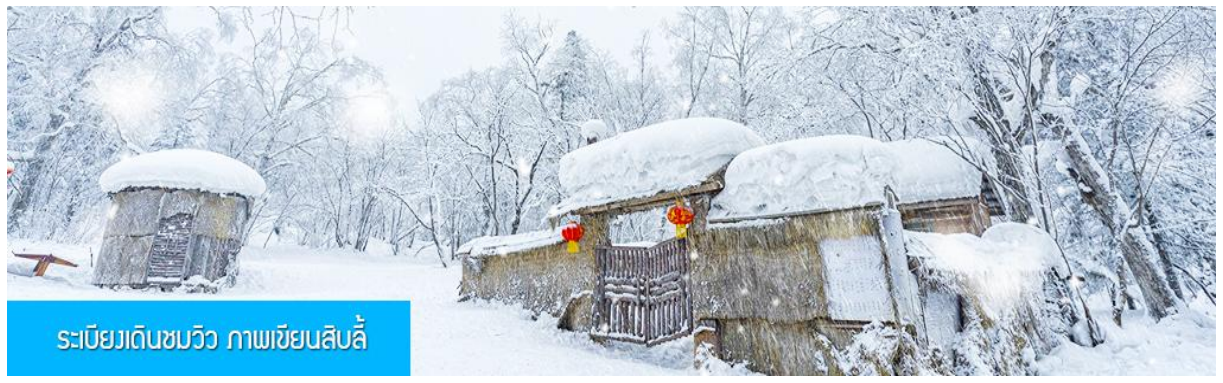
ระเบียบเดินชมวิว ภาพเขียนสิบลี้