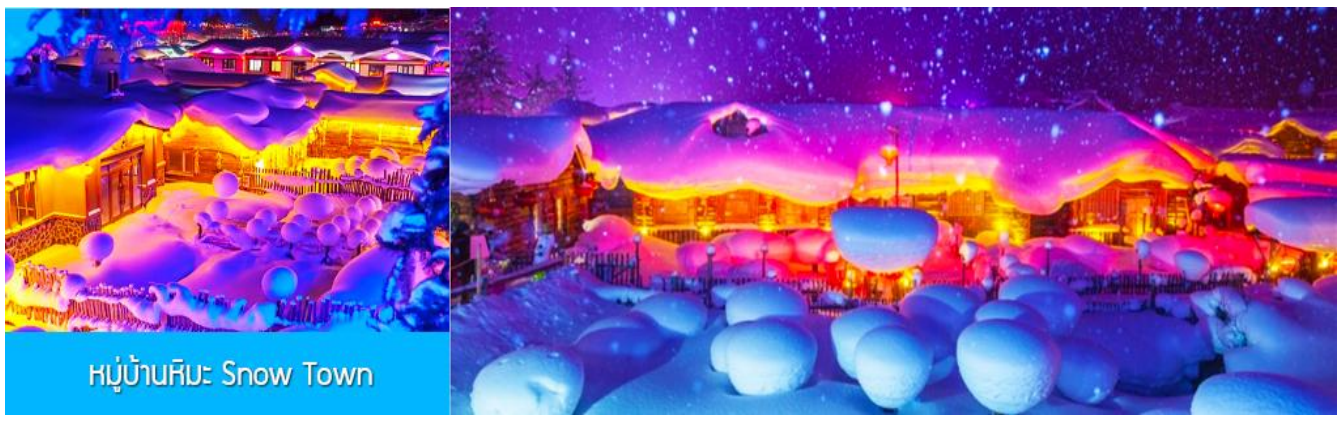
หมู่บ้านหิมะ: Snow Town

นำท่านสัมผัสประสบการณ์ นั่งม้าลากเลื่อน เล่นผ่านลานหิมะและแนวป่า 馬拉雪橇 (รวมในค่าทัวร์แล้ว) ท่ามกลางท้องทุ่งและผืนป่าที่ปกคลุมด้วยหิมะราวกับอยู่ในโลกแห่งเทพนิยาย ผ่านหมู่บ้าน เวहुจ้าย 威虎寨 ที่อดีตเคยเป็นที่ตั้งของรังโจรที่มักออกปล้นสะดมชาวบ้าน ม้าลากเลื่อนเป็นยานพาหนะเฉพาะพื้นที่ ๆ ที่นิยมนำมาใช้ในการเดินทางหรือลำเลียงสิ่งของในช่วงฤดูหนาว ที่ใช้ม้าลากจูงแคร่เลื่อนให้สามารถเคลื่อนย้ายบนลานหิมะได้