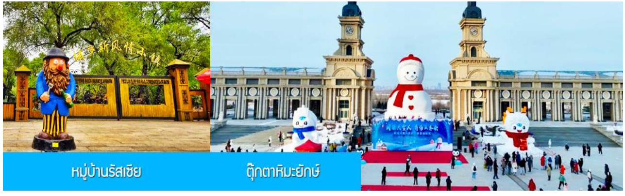
หมู่บ้านรัสเซีย

นำท่าน นั่งกระเช้าชมความสวยงามของแม่น้ำซวงฮัวเจียงในฤดูหนาว 乘缆车跨越松花江 แม่น้ำสายหลักที่ไหลผ่านเมืองฮาร์บิน ในช่วงฤดูหนาวน้ำในแม่น้ำซวงฮัวจะกลายเป็นลานน้ำแข็งขนาดใหญ่และปกคลุมด้วยหิมะ ชม หมู่บ้านรัสเซีย 俄罗斯小镇 ชมบ้านเรือนและริสอร์ทสไตล์รัสเซียรวม 27 หลังภายในหมู่บ้านเล็ก ๆ แห่งนี้ ตั้งอยู่บนเกาะพระอาทิตย์ 位于太阳岛上 เมื่อนักท่องเที่ยวมาเยือนในหมู่บ้านเสมือนท่านกำลังเดินเล่นอยู่ในหมู่บ้านหนึ่งใน รัสเซีย