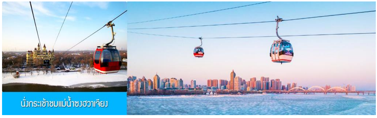
นั่งกระเช้าชมแม่น้ำซวงเวียง

พักที่ VIENNA INTER HOTEL โรงแรมระดับ 4 ดาวท้องถิ่น ในเมืองเมืองซังจี้