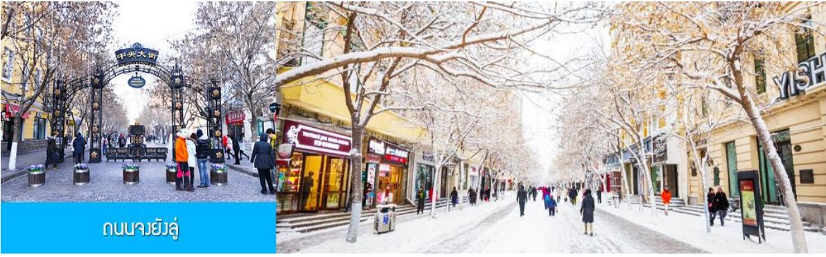
ถนนจวิ๋ลู่

จากนั้นนำท่านเที่ยวชม ถนนจวิ๋ลู่ 中央大街 ถนนสายหลักของเมืองฮาร์บิน ถนนที่เต็มไปด้วยอาคารบ้านเรือนที่เป็นสถาปัตยกรรมตะวันตกที่สร้างในช่วงคริสต์ศตวรรษที่ 18 – 19 ที่เมืองนี้ถูกปกครองโดยรัสเซีย อีกทั้งเป็นถนนคนเดินที่เป็นแหล่งรวมร้านค้าสินค้าแบรนด์เนมทั้งในและต่างประเทศ ร้านจำหน่ายของที่ระลึกและสินค้าพื้นเมือง ร้านอาหารพื้นเมืองต่าง ๆ มากมาย ให้ท่านมีเวลาอิสระเดินเที่ยวและช้อปปิ้ง หรือลิ้มรสอาหารพื้นเมืองตามอัธยาศัย.. **ให้ท่านลิ้มรสไอศกรีมชื่อดังเก่าแก่ของเมืองฮาร์บินท่านละ 1 ท่านฟรี