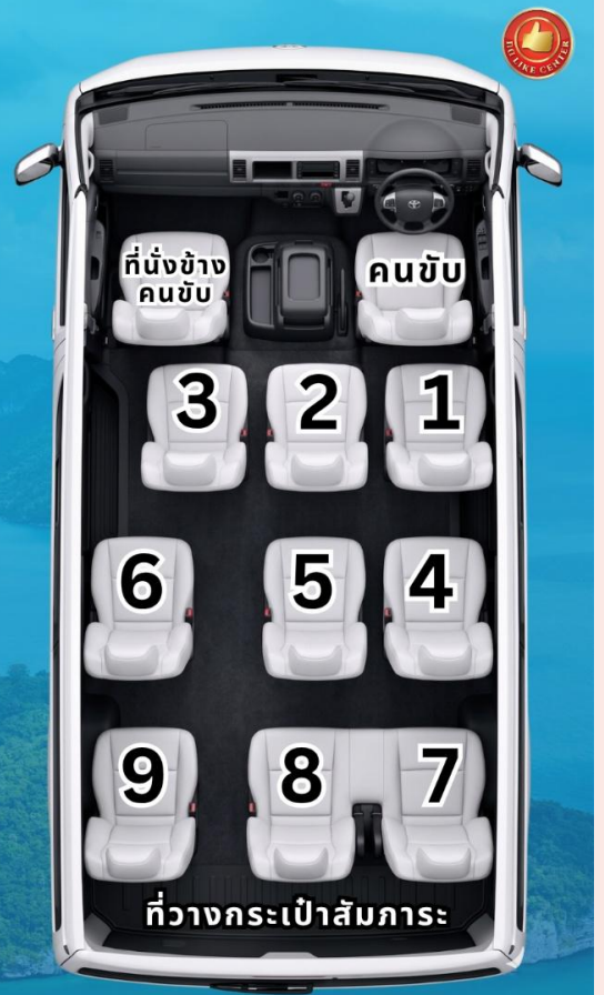
** ภาพรถนี้เป็นเพียงภาพจำลองเพื่อประกอบการแสดงผลเท่านั้น **

ลูกค้าที่ไม่ได้สำรองที่นั่ง บริษัทฯ ขอสงวนสิทธิ์ในการจัดที่นั่งตามความเหมาะสม