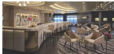
Magnum's Champagne Bar

Inspired by the Art Nouveau era using Charles Rennie Mackintosh's design elements and colors. Seating capacity 99