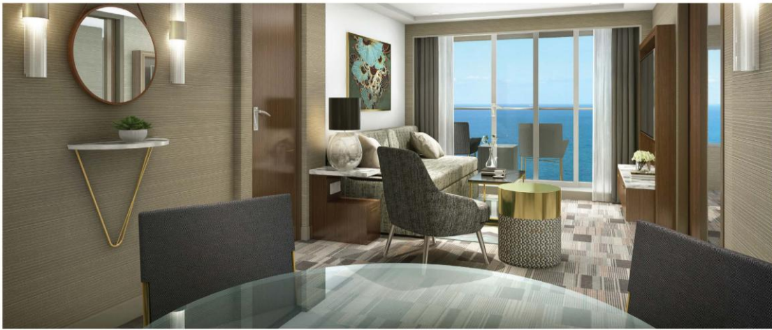
Penthouse with Large Balcony