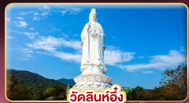
วัดลินห์ฮอ้ง