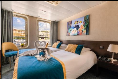
ห้องมีหน้าต่าง panoramic view