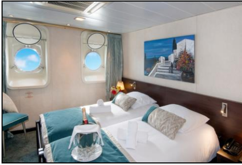
ห้องมีหน้าต่าง portholes