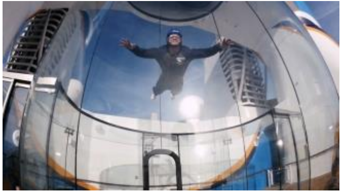
Ripcord by iFLY