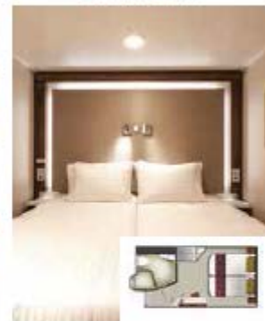
From 16 sq.m Max Occupancy 2 - 4 Deck 5/9/10/11/12/13 2 Single Beds - 2 Single Sofa Beds/ 1 Single Sofa Bed