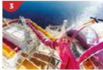
Waterslide Park Get drenched in fun on one of our six different waterslides.