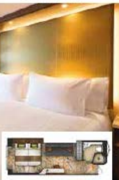
From 20 sq.m Max Occupancy 3-4 Deck 8/9/10/11/12/13/15 1 Queen-size Bed - 1 Single Sofa Bed/ 1 Single Sofa Bed - 1 Ceiling Pullman Bed