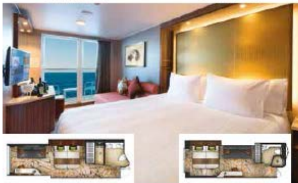
From 22 sq.m Max Occupancy 3-4 Deck 8/9/10/11/12/13/15 1 Queen-size Bed - 1 Single Sofa Bed/ 1 Double Sofa Bed/ 1 Single Sofa Bed - 1 Ceiling Pullman Bed