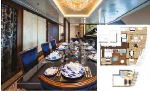
Approx. 224 sq.m | Max Occupancy 6 | Deck 17 1 King-size Bed - 1 Queen-size Bed - 1 Double Sofa Bed