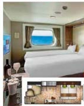
From 16 sq.m Max Occupancy 2-4 Deck 5/9/10/11/12/13 2 Single Beds - 2 Single Sofa Beds/ 1 Single Sofa Bed