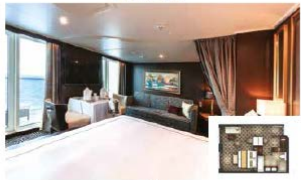
From 37 sq.m Max Occupancy 4 | Deck 13/15/16/17 1 Queen-size Bed - 1 Double Sofa Bed