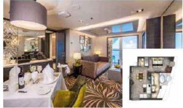
Approx. 37/56 sq.m | Max Occupancy 4-6* | Deck 13/16 1 King-size Bed - 1 Double Sofa Bed