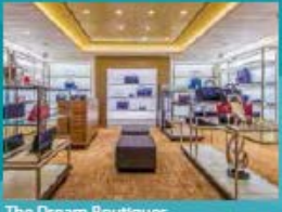
The Dream Boutiques Splurge on duty-free shopping