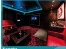
Karaoke Five private karaoke rooms