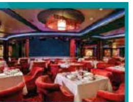
Silk Road Chinese Restaurant Chinese fine dining in old glamour setting