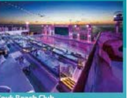
Zouk Beach Club Outdoor party/entertainment venue