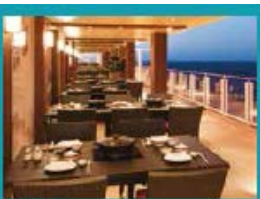
Hot Pot Outdoor hot pot with scenic ocean views