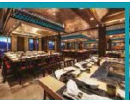
Umi Uma Teppanyaki Grand tables for grilling action