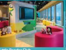
Little Pandas Club Kids club with supervised activities