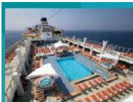
Main Pool Deck Stay cool at the swimming pool