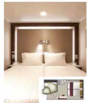
From 16 sq.m Max Occupancy 2 - 4 Deck 5/9/10/11/12/13 2 Single Beds - 2 Single Sofa Beds/ 1 Single Sofa Bed