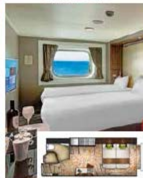
From 20 sq.m Max Occupancy 3 - 4 Deck 8/9/10/11/12/13/15 1 Queen-size Bed - 1 Single Sofa Bed/ 1 Single Sofa Bed - 1 Ceiling Pullman Bed