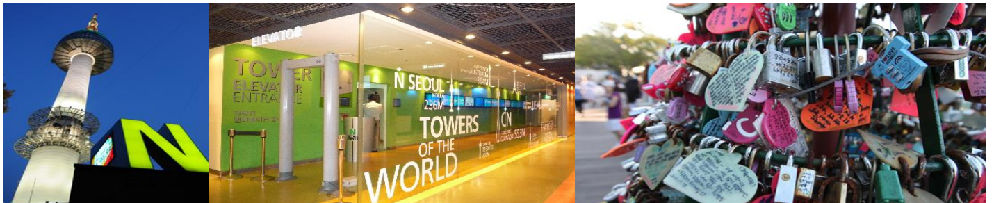
หลังอาหารกลางวัน

พาท่านขึ้นภูเขาซัมซาน #Namsan – ภูเขาเพียงลูกเดียวใจกลางเมืองหลวงและอิสระถ่ายรูปคู่หอคอย N Tower สูงถึง 480 เมตรเหนือระดับน้ำทะเล สถานที่ละครหนังเกาหลีหรือหนังไทยสไตล์เกาหลีมาถ่ายทำ กัน (ความเชื่อ: เตรียมแม่กุญแจลูกกุญแจเพื่อไปล็อคกุญแจคู่รัก ณ Love Rock Cable ซึ่งเชื่อกันว่า ถ้า ใครขึ้นมาคล้องกุญแจและโยนลูกกุญแจทิ้งไป คู่รัก คู่ครอบครัว คู่เพื่อน คู่พี่น้อง คู่มิตรนั้นจะมีความรักที่ ยั่งยืนหรือไม่มีใครมาพรากจากกันได้) (ค่าบัตรลิฟท์ขึ้นสู่จุดชมวิวนบนหอคอย ไม่รวมไว้ในค่าทัวร์)