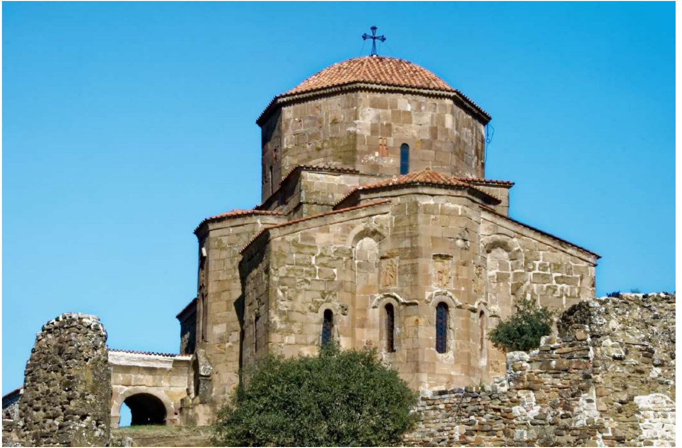
จากนั้น นำท่านแวะชมวิหารสเวตีสโกเวรี(Svetitskhoveli Cathedral) เป็นโบสถ์เก่าแก่อีกแห่งตั้งอยู่ในบริเวณเมืองมัคสเคด้าลักษณะโบสถ์วิหารศิลปะแบบจอร์เจียนออร์ธอด็อก