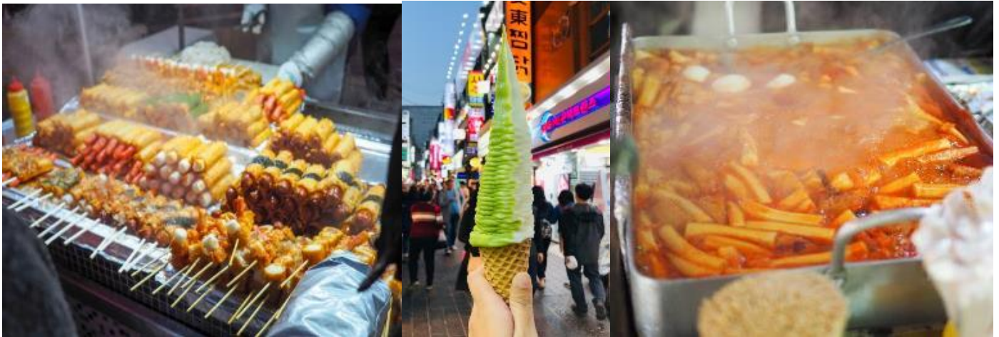
คำ อีระอาหารค้าย่านเมียงดง เพื่อความสะดวกในการท่องเที่ยว ที่พัก KOREA L'ART HOTEL หรือเทียบเท่า

DAY 5 ศูนย์สมุนไพรเกาหลี – โรงงานเจียรไร้อเมทิส – สวนสาธารณะยออีโด - พิพิธภัณฑ์สहरาย – ศูนย์ไดพริเมียม แฮาร์ทเลท – ร้านละลายเงินวอน – ท่าอากาศยานนานาชาติอินชอน – กรุงเทพฯ (สุวรรณภูมิ) พิเศษ !! ให้ท่านได้ทำกิมจิ และใส่ชุดประจำชาติเกาหลี "ฮันบก" (Hanbok) (B/L/-)