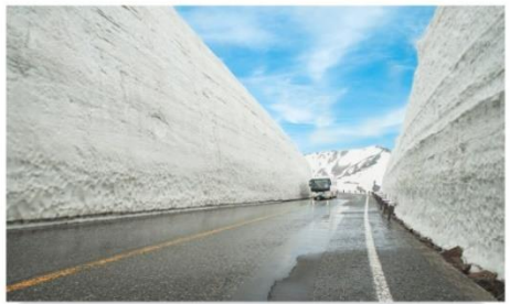
กำแพงหิมะ