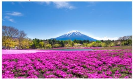
เทศกาลชิบะซากุระ