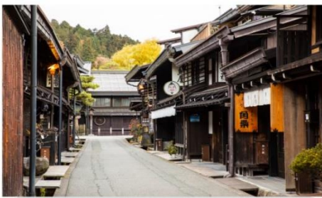
เมืองเก่าซันมาจิ