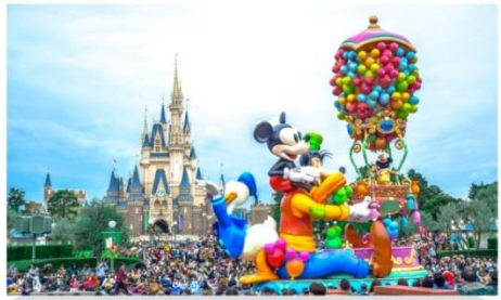
โตเกียวดิสนีย์