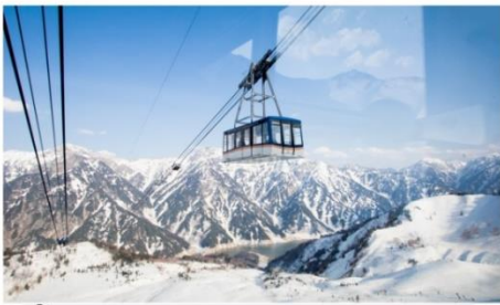
ขึ้นกระเช้าพาโนรามา