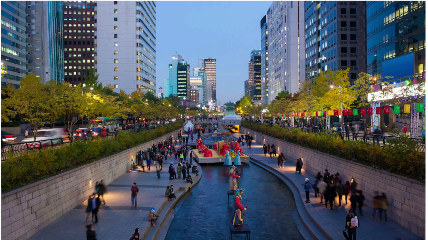
เดินทางสู่ กรุงโซล โดยรถไฟความเร็วสูง KTX