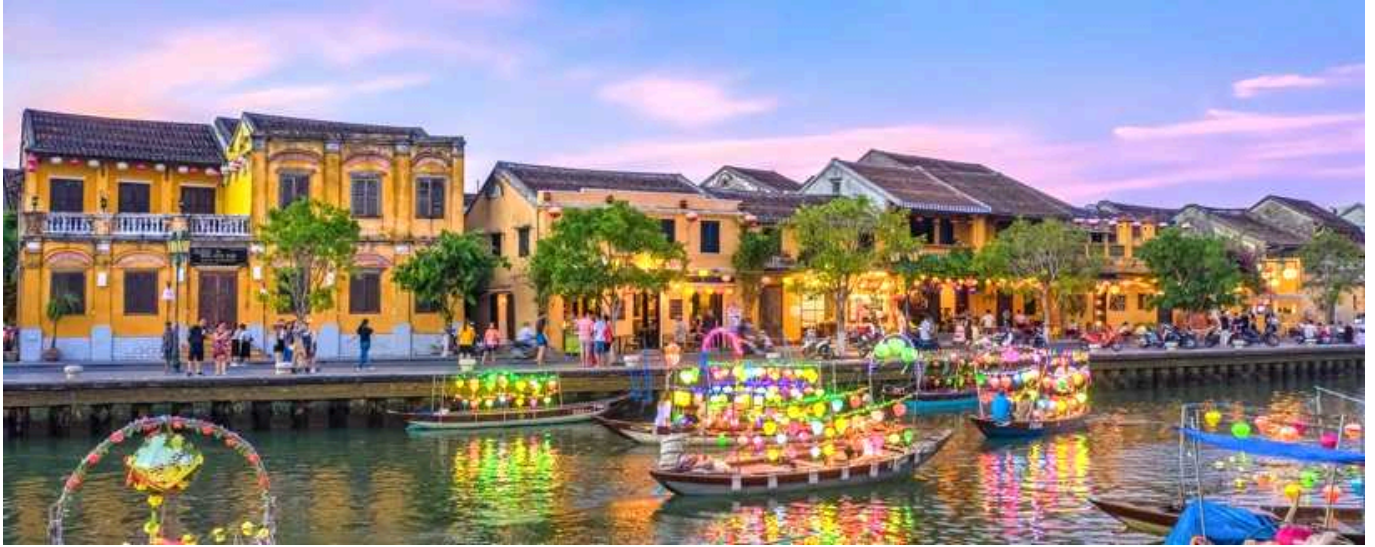
กลางวัน รับประทานอาหารกลางวัน ณ ภัตตาคาร