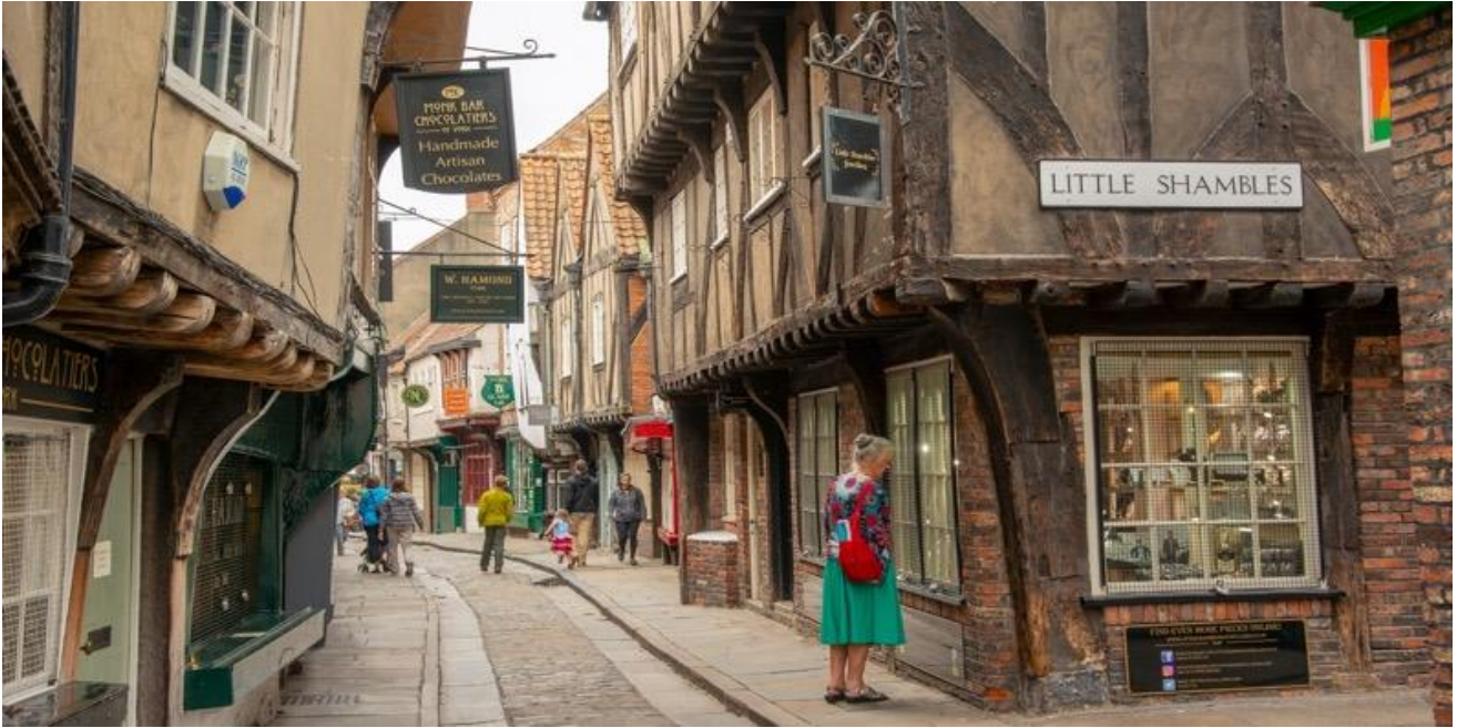
เย็น รับประทานอาหารเย็น ณ ภัตตาคาร (เมนูอาหารท้องถิ่น) พักที่ Hotel Hampton by Hilton York Piccadilly หรือเทียบเท่า

KUK111088-EK Expecting Englang London Bath Manchester Edinburgh 10D7N