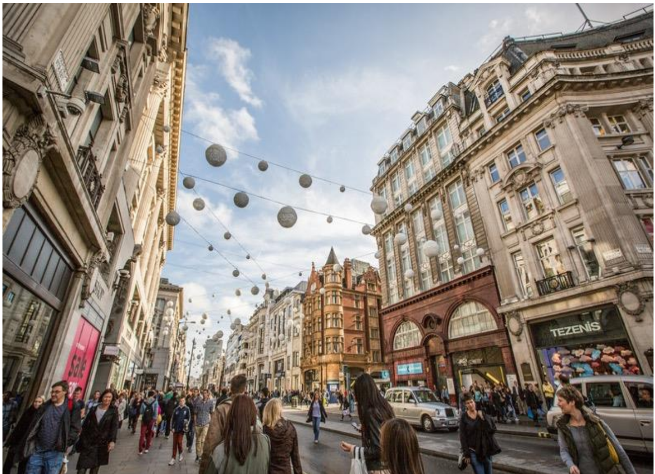
ห้างสรรพสินค้าเฮาส์ ออฟ เฟรเซอร์ ฯลฯ ซึ่งแต่ละห้างก็ล้วนแล้วแต่มีชื่อเสียงด้วยกันทั้งสิ้น

นำท่านอิสระช้อปปิ้งสินค้าแบรนด์เนม ณ ถนนอ็อกฟอร์ด (Oxford Street) เป็นย่านชื่อดังในกรุงลอนดอน ประเทศอังกฤษ มีความยาวถึง 1.6 กม มีร้านค้า ห้างสรรพสินค้าชั้นนำของอังกฤษ และช้อปปิ้งเซ็นเตอร์มารวมกันอยู่บนถนนเส้นเดียวกันมากมาย ไม่ว่าจะเป็นพลาซ่า อ็อกฟอร์ดสตรีท, ห้างสรรพสินค้าจอห์นหลุยส์,