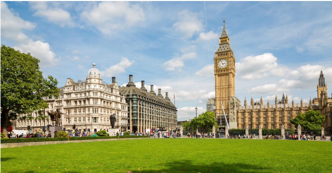
ลอนดอนในการถ่ายทอดเสียงการตีระฆังไปทั่วโลก

นำท่านเดินทางสู่ จัตุรัสทราฟัลการ์ (Trafalgar Square) จตุรัสกลางเมืองที่รายล้อมไปด้วยอาคารราชการสำคัญของเมืองลอนดอน นำท่าน ถ่ายรูปเป็นที่ระลึก กับ จัตุรัสรัฐสภา (Parliament Square) และ พระราชวังเวสต์มินสเตอร์ (Westminster Palace) หรือ ตึกรัฐสภาเวสต์มินสเตอร์ (Houses of Parliament) เป็นสถานที่ที่สภาสองสภาของรัฐสภาแห่งสหราชอาณาจักร (สภาขุนนาง และสภาสามัญชน) ใช้ประชุม สิ่งก่อสร้างส่วนใหญ่สร้างในคริสต์ศตวรรษที่ 19 แต่ก็ยังมีส่วนก่อสร้างเดิมเหลืออยู่บ้างเล็กน้อยรวมทั้งห้องพระโรงที่ในปัจจุบันใช้ในงานสำคัญๆ ได้รับการขึ้นทะเบียนให้เป็นมรดกโลกโดยองค์การสหประชาชาติ หรือ ยูเนสโก เมื่อปี ค.ศ. 1987 นำท่านถ่ายภาพคู่กับ หอนาฬิกาบิ๊กเบน (Big Ben) ของกรุงลอนดอนประเทศอังกฤษ ตั้งอยู่บนหอสูง 180 ฟุต หน้าปัดกว้าง 23 ฟุต ตัวเลขบอกเวลา ยาว 24 นิ้ว ระฆังตีหนักถึง 14 ตัน สร้างขึ้นโดย เอ็ดมันด์ เมคเกตต์ เดนิสัน เป็นนาฬิกาที่ใหญ่ที่สุดในโลก เป็นศูนย์ควบคุมเวลามาตรฐานของโลกกรีนิช ซึ่งใช้ในการบอกเวลาของโลกโดยผ่านทางวิทยุ BBC