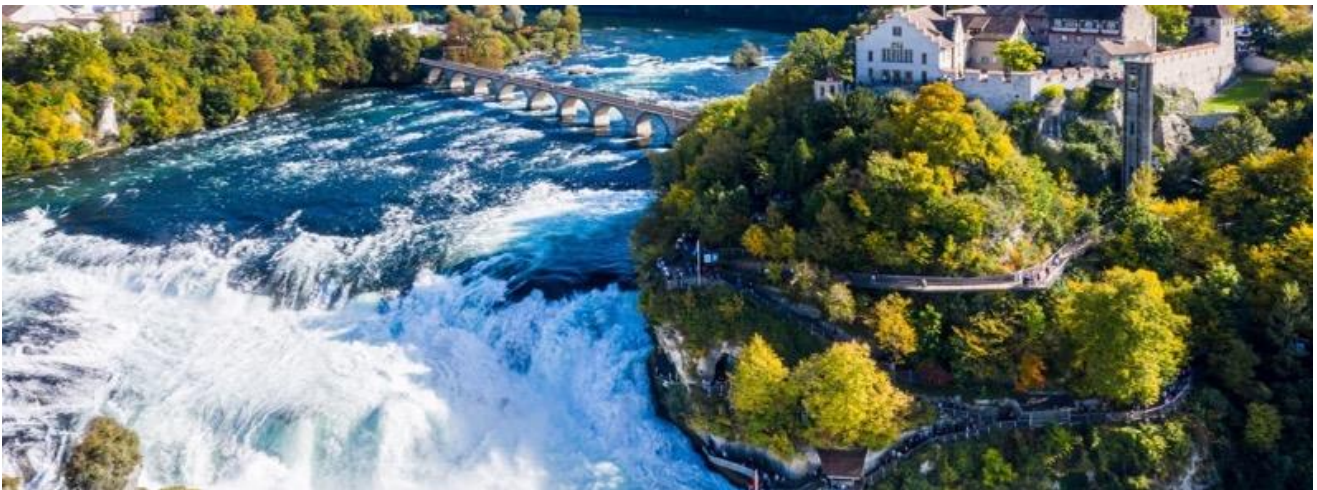
สวิตเซอร์แลนด์ ได้เวลาพักผ่อน

นำท่านเดินทางสู่ เมืองชาร์ฟเฮาเซน (Schaffhausen) เป็นเมืองทางตอนเหนือของประเทศสวิตเซอร์แลนด์ เป็นเมืองหลวงของรัฐชัฟเฮาเซน มีประชากรราว 34,587 คน ในเดือนธันวาคม ค.ศ. 2008 มีอาคารเก่าในสมัยฟื้นฟูศิลปวิทยาหลายแห่ง ประดับประดาภายนอกด้วยศิลปะเรอเนสซองส์และประติมากรรม มีน้ำตกไรน์ เป็นแหล่งท่องเที่ยว นำท่านเที่ยวชม น้ำตกไรน์ (Rhinefall) เป็นน้ำตกที่ใหญ่ที่สุดในยุโรป ด้วยความสูงของน้ำตก 23 เมตร และกว้างกว่า 150 เมตร น้ำตกไรน์นี้ เป็นน้ำตกโบราณ มีอายุเก่าแก่มาประมาณ 14,000 - 17,000 ปี และ เป็นน้ำตกที่ใหญ่ที่สุดในยุโรปและเป็นน้ำตกที่เกิดจากแม่น้ำ ไรน์ อยู่ระหว่างเมืองเล็ก ๆ ชื่อ Neuhausen am Rheinfall กับ เมือง Laufen-Uhwiesen ใกล้ๆเมือง เมืองชาร์ฟเฮาเซน (Schaffhausen) ทางตอนเหนือของประเทศ