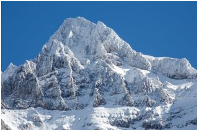
กลางวัน รับประทานอาหารกลางวัน ณ ภัตตาคารบนเขาพร้อมวิวเขาแสนสวย