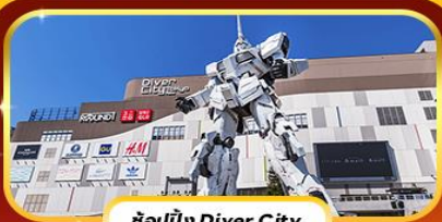
ช้อปปิ้ง Diver City