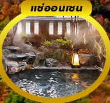
แช่ออนเซ็น