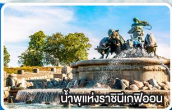
น้ำพุแห่งราชินีก๊อปเปน