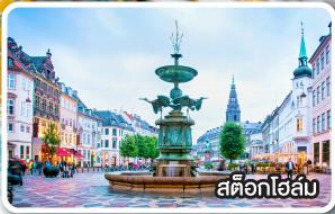
สต็อกโฮล์ม