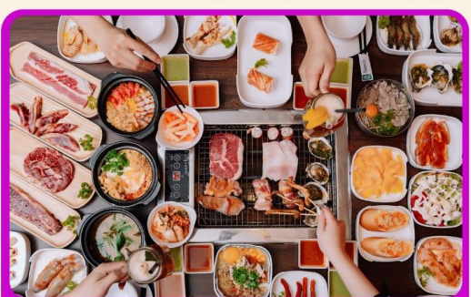
พิเศษ!! เมนูชาฮี+บุฟเฟ่ต์ปิ้งย่าง