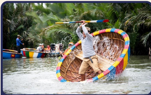
พิศข !!! นั่งเรือกระดัง UNSEEN เวียดนาม