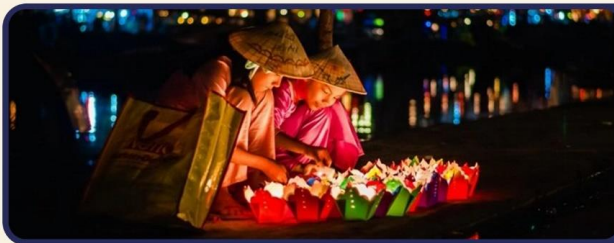
ส่องเรือลอยกระทงที่ฮอยอัน