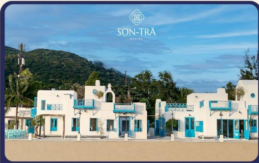
เช็กอิน Cafe Son Tra Marina คาเฟ่ริมทะเลแห่งใหม่ของเมืองดานัง