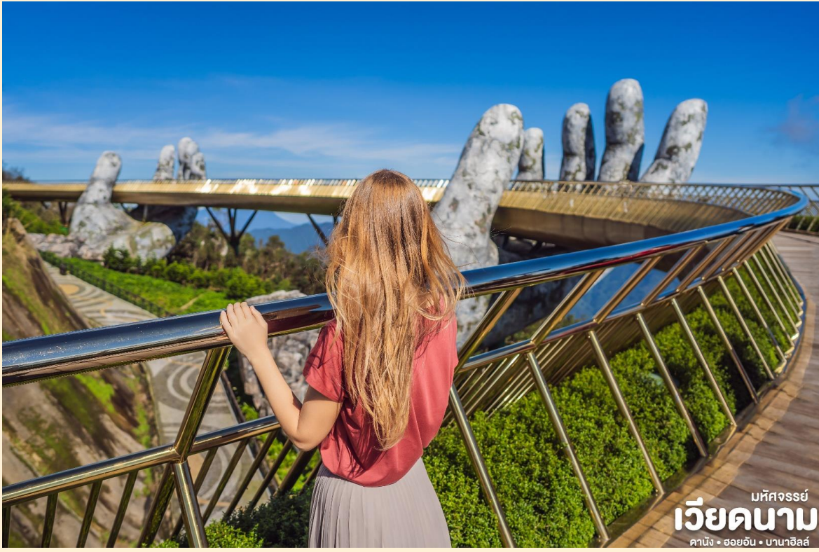
มหิศจรรย์ เวียดนาม ดานัง • ฮอยอัน • บานาฮิลล์

กว่ากระเช้าพร้อมอากาศบริสุทธิ์อันสดชื่นจนทำให้ท่านอาจลืมไปเสียด้วยซ้ำว่าที่นี่ไม่ใช่ยุโรป เพราะอากาศที่หนาวเย็นเฉลี่ยตลอดทั้งปีประมาณ 10 องศาเท่านั้นจุดที่สูงที่สุดของบานาฮิลล์มีความสูง 1,467 เมตรกับสภาพผืนป่าที่อุดมสมบูรณ์ นำท่านชม สะพานสีทอง สถานที่ท่องเที่ยวใหม่ล่าสุดตั้งโดดเด่นเป็นเอกลักษณ์อย่างสวยงาม บนเขาบานาฮิลล์