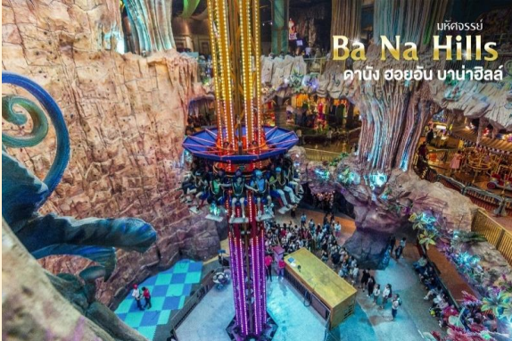
มหิศจรรย์ Ba Na Hills ดานัง ฮอยอัน บานาฮิลล์

จุดที่สร้างความตื่นเต้นให้นักท่องเที่ยว มองดูอย่างอลังการที่ซึ่งเต็มไปด้วยเสน่ห์ แห่งตำนานและจินตนาการของการ์ตูน ผจญภัยที่ สวนสนุก The Fantasy Park (รวมค่าเครื่องเล่นบนสวนสนุก ยกเว้น หุ่นซีฟิ่งที่ไม่รวมให้ในรายการ) ที่เป็น ส่วนหนึ่งของบานาฮิลล์ท่านจะได้พบกับ