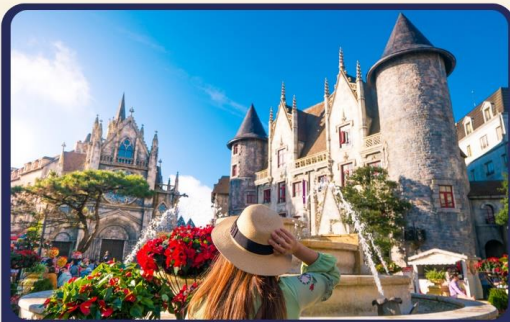
เที่ยวบานาฮิลล์แบบจุใจ เต็มวัน