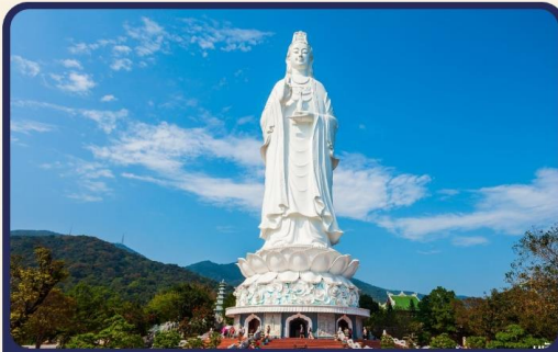
วัดลินห์อึ้ง (Linh Ung) วัดที่ใหญ่ที่สุดของเมืองดานัง