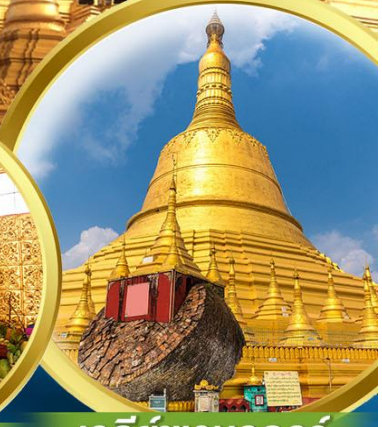
เจดีย์ชเวมอดอร์

พิเศษ!! กุ้งแม่น้ำเผา + Buffet Hotpot นานาชาติ