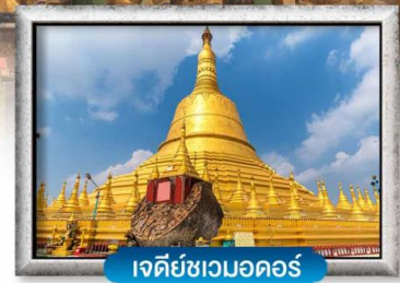
เจดีย์ชเวมอดอร์