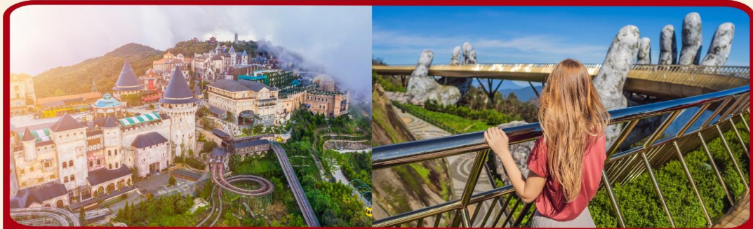
เที่ยวบานาฮิลล์เต็มวัน แบบจุใจ