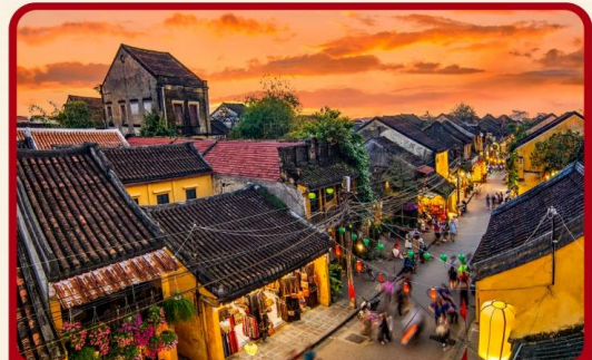
เที่ยวเมืองเก่าฮอยอัน