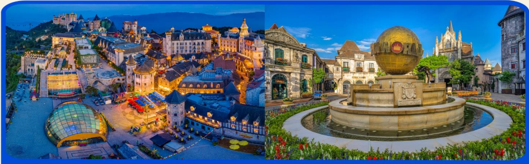
พักผ่อน บานาฮิลล์ 1 คืน