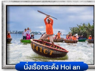
นั่งเรือกระดัง Hoi an