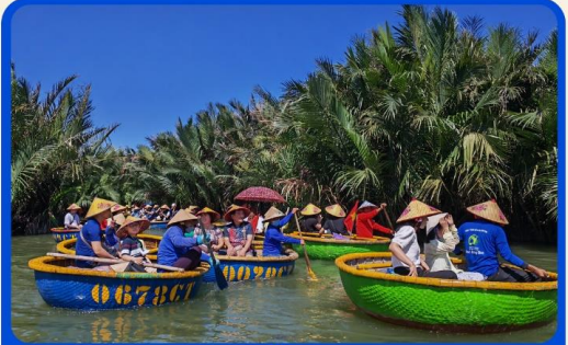
พิเศษ !!! นั่งเรือกระดัง UNSEEN เวียดนาม