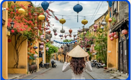
เที่ยวเมืองเก่าฮอยอัน