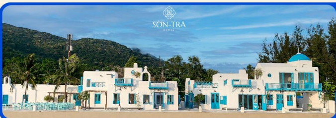
เช็คอินคาเฟ่ SON TRA MARINA