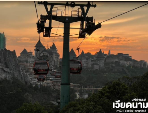
ที่พักจอร์จีย์ เวียดนาม ดานัง • ฮอยอัน • บานาฮิลล์

จากนั้น นั่งกระเช้าขึ้นสู่บานาฮิลล์ กระเช้าแห่งบานาฮิลล์ นี้ได้รับการบันทึกสถิติโลกโดย World Record ว่าเป็นกระเช้าไฟฟ้าที่ยาวที่สุด ประเภท Non Stop โดยไม่หยุดแวะมีความยาวทั้งสิ้น 5,042 เมตร และเป็นกระเช้าที่สูงที่สุด 1,294 เมตร นักท่องเที่ยวจะได้สัมผัสบรรยากาศและบางจุดมีเมฆลอยต่ำกว่ากระเช้าพร้อมอากาศบริสุทธิ์อันสดชื่นจนทำให้ท่านอาจลืมไปเสียด้วยซ้ำว่าที่นี่ไม่ใช่ยุโรปเพราะอากาศที่หนาวเย็นเฉลี่ยตลอดทั้งปี ประมาณ 10 องศาเท่านั้น