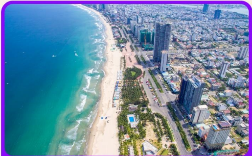
เช็คอน ชายหาดหมีเคว เป็นชายหาดที่สวยงามที่สุดในเมืองดานัง