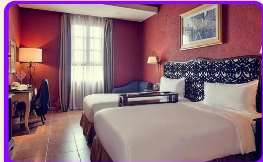
พักบานาฮิลล์ 1 คืน