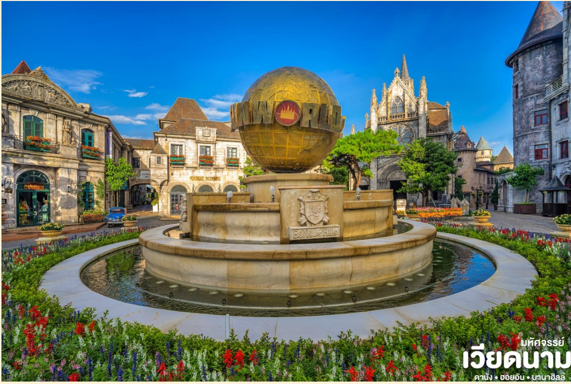
ที่พักจอร์จีย์ เวียดนาม ดานัง • ฮอยอัน • บานาฮิลล์