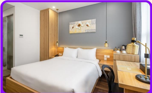
พักเมืองดานัง 4 ดาว 2 คืน