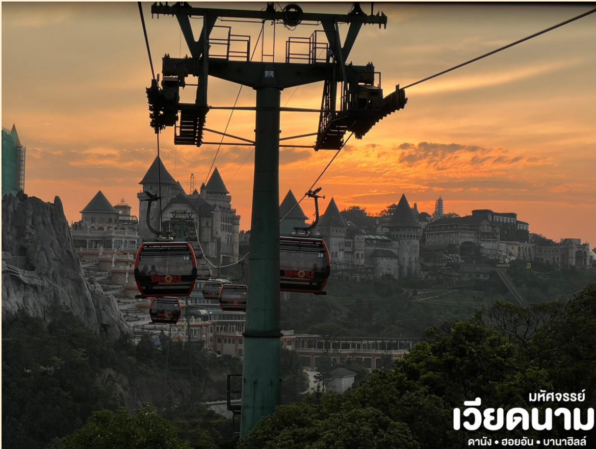
มหัศจรรย์ เวียดนาม ดานัง • ฮอยอัน • บาน่าฮิลล์

เช้า ๑๗ บริการอาหารเช้า ณ ห้องอาหารโรงแรม จากนั้น นั่งกระเช้าขึ้นสู่บาน่าฮิลล์ กระเช้าแห่งบาน่าฮิลล์นี้ได้รับการบันทึกสถิติโลกโดยWorld Record ว่าเป็นกระเช้าไฟฟ้าที่ยาวที่สุด ประเภท Non Stop โดยไม่หยุดแวะมีความยาวทั้งสิ้น 5,042 เมตร และเป็นกระเช้าที่สูงที่สุด 1,294 เมตร นักท่องเที่ยวจะได้สัมผัสบรรยากาศและบางจุดมีเมฆลอยต่ำกว่ากระเช้าพร้อมอากาศบริสุทธิ์อันสดชื่นจนทำให้ท่านอาจลืมไปเสียด้วยซ้ำว่าที่นี่ไม่ใช่ยุโรป เพราะอากาศที่หนาวเย็นเฉลี่ยตลอดทั้งปีประมาณ 10 องศาเท่านั้น