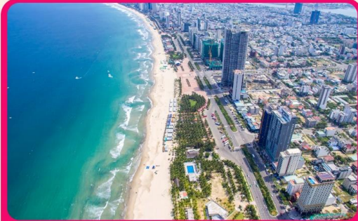
เช็คอิน ชายหาดหมีควา เป็นชายหาดที่สวยงามที่สุดในเมืองดานัง