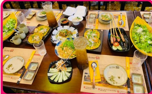
พิเศษ !!! เมนูหม่อมเมืองสไตล์เวียดนาม