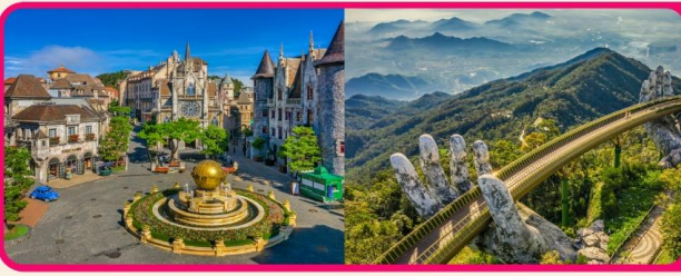
เที่ยวบานาฮิลล์แบบจุใจ เต็มวัน