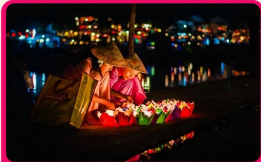
ส่องเรือลอยกระทงที่ฮอยอัน