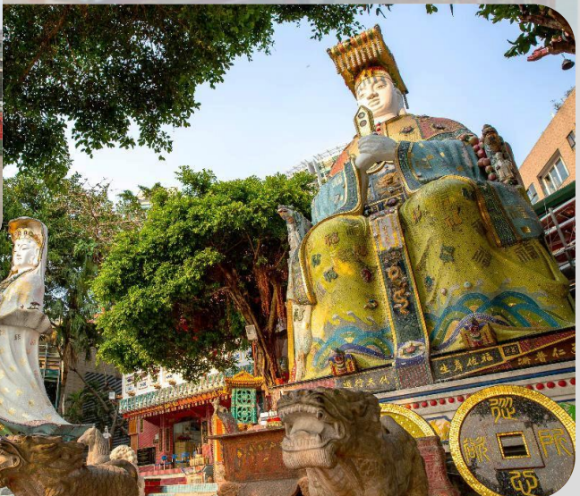
GO1HKG-EK035 Hong Kong ฮ่องกง สายมูทันใจ ไหว้พระ 9 วัด 3 วัน 2 คืน โดยสายการบิน Emirates (EK)