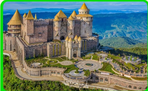
เที่ยวบานาฮิลล์แบบจุใจ เต็มวัน