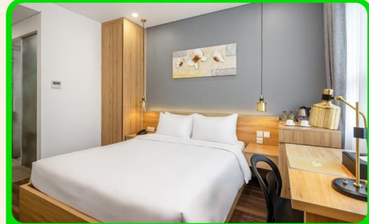
พักเมืองดานัง 4 ดาว 3 คืน