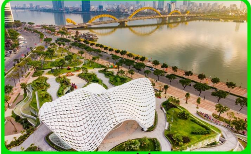
เซ็คอิน แหล่งที่เที่ยงใหม่ APEC PARK