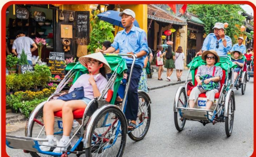
นั่งรถสามล้อฮิโคล ชมเมืองเว้ เมืองแห่งมรดกโลก