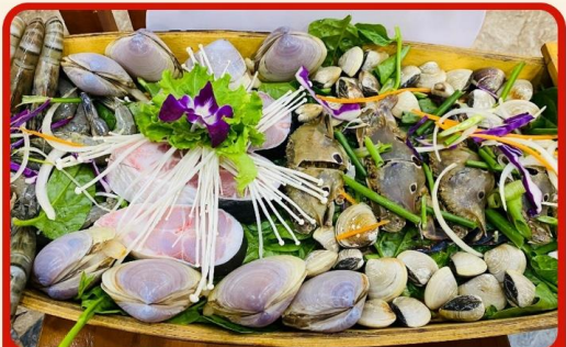
พิเศษ !!! Premium Seafood Hotpot Boatget