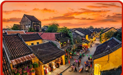
เที่ยวเมืองเก่าฮอยอัน