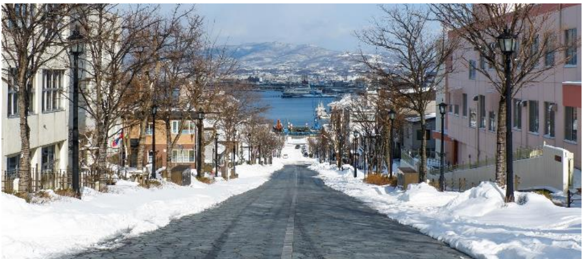
GO2CTS-TG012-- HOKKAIDO HAKODATE OTARU CANAL 6D4N BY TG

ย่านโมโตมาจิ (Motomachi) จากเชิงเขาฮาโกดาเตะ มีถนนลาดชัน 19 สายมุ่งตรงสู่ท่าเรือ ถนนเหล่านี้เป็นที่นิยมในหมู่ผู้รักการเดินเที่ยวชมวิว เนื่องจากเรียงรายไปด้วยอาคารต่าง ๆ ที่มีเอกลักษณ์ และมีภูมิทัศน์อันหลากหลายเมื่อครั้งอดีตได้เป็นเมืองท่าที่มีการค้าขายกับชาวต่างชาติฝั่งตะวันตก ซึ่งทำให้วัฒนธรรมตะวันตกได้เข้ามามีบทบาทในเมืองฮาโกดาเตะ ซึ่งท่านจะพบเห็นจากโบสถ์คริสต์ ร้านอาหาร อาคารบ้านเรือนเก่าแบบตะวันตกที่ตั้งอยู่ริมเนินเขา