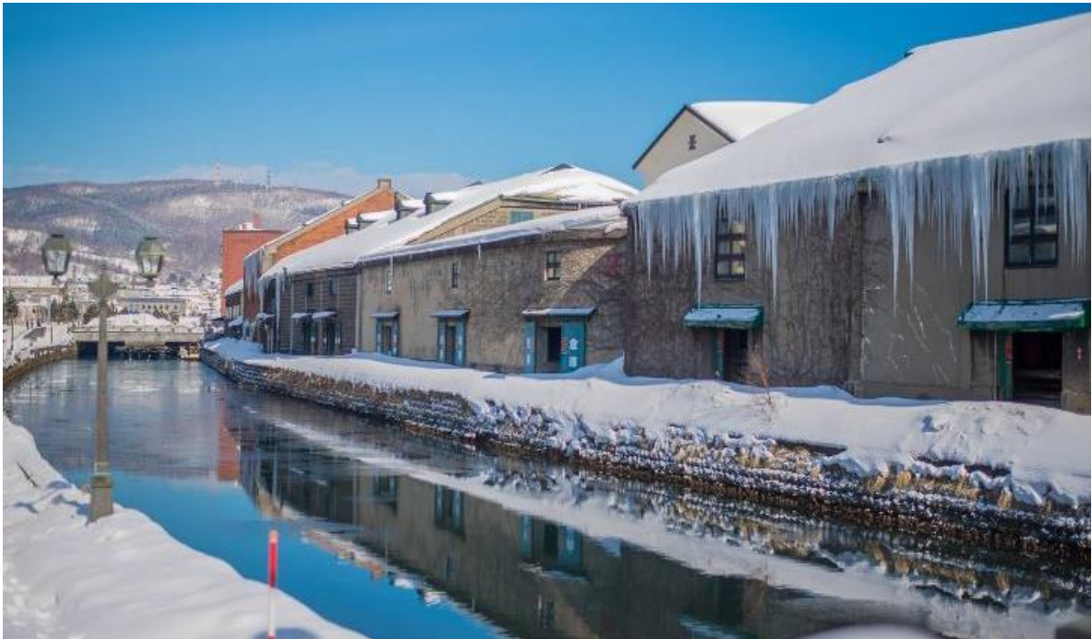
GO2CTS-TG012-- HOKKAIDO HAKODATE OTARU CANAL 6D4N BY TG

นำท่านเดินทางสู่ เมืองโอตารุ (Otaru) เมืองโรมานติคของเกาะฮอกไกโด ที่ควบคู่ไปกับความเก่าแก่และความสำคัญทางประวัติศาสตร์ แวะชม คลองโอตารุ (Otaru Canal) ที่มีความยาว 1,140 เมตร และเชื่อมต่อกับอ่าวโอตารุ ซึ่งในสมัยก่อนประมาณ ค.ศ.1920 ที่ยุคอุตสาหกรรมขนส่งทางเรือเพื่อฟูกุ คลองแห่งนี้ได้ถูกใช้เป็นเส้นทางในการขนส่งสินค้าจากคลังสินค้าในตัวเมืองโอตารุ ออกไปยังท่าเรือบริเวณปากอ่าวให้ท่านเดินเล่น พร้อมถ่ายรูปอ้อยาศัย กับอาคารเก่าแก่ริมคลองและวิวทิวทัศน์ที่สวยงาม