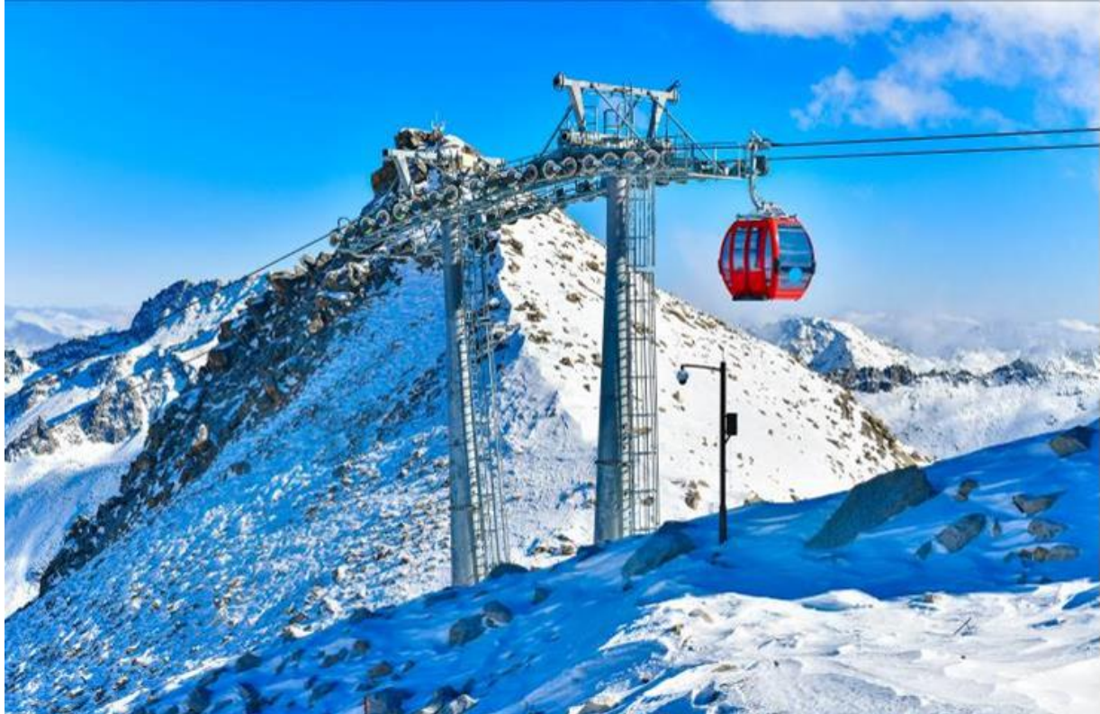
GO1TFU-TG024 เฉิงตู จิวจ้ายโกว โหมวหนี่โกว ภูผาหิมะการ์เซียต้ากู่ปังชวณ 6วัน 5คืน โดยสายการบิน Thai Airways (TG)

จากนั้นนำท่านเดินทางสู่ อุทยานสวรรค์ภูผาหิมะการ์เซีย“ต้ากู่ปังชวณ” ถูกค้นพบผ่านดาวเทียมเมื่อปี ค.ศ. 1992 โดยนักวิทยาศาสตร์ชาวญี่ปุ่น หลังจากได้ตรวจสอบพื้นที่จึงทราบว่าที่เป็นธารน้ำแข็งที่ตั้งอยู่ต่ำที่สุด ใหญ่ที่สุด และอายุน้อยที่สุดในโลก และยังคงตั้งอยู่ไม่ไกลจากตัวเมืองทำให้สามารถเดินทางไปท่องเที่ยวได้ง่าย ซึ่งคนในพื้นที่มีความเชื่อว่าภายในธารน้ำแข็งแห่งนี้มีเทพเจ้าศักดิ์สิทธิ์พิทักษ์อยู่ จึงทำให้ไม่มีใครสามารถพิชิตยอดเขาแห่งนี้ได้จุดที่สูงที่สุดมีความสูงจากระดับน้ำทะเลประมาณ 5,286 เมตรเป็นภูผาธารน้ำแข็งที่ศักดิ์สิทธิ์ ชาวบ้านเชื่อว่าเทพเจ้าพิทักษ์ภูเขาแห่งนี้อยู่ทำให้ภูผาแห่งนี้ยังมีใครพิชิตยอดเขาได้ นำท่าน นั่งกระเช้าเคเบิลคาร์ ขึ้นไปยังจุดสูงสุดของภูเขาที่มีความสูง 4,860 เมตรที่เชื่อว่าเป็นสันหลังมังกรที่มีความงดงามจากเบื้องหน้าเป็นภูเขาที่สูงชันตัดกับท้องฟ้าที่มีสีฟ้าครามสดใสและพระอาทิตย์สะท้อนการเขี่ยคล้ายดั่งภูเขาเงินระยิบระยับ วิวในช่วงหน้าหนาวจะเป็นสีขาวเต็มไปดด้วยหิมะน้ำแข็งที่ดูแล้วคล้ายดั่งยืนอยู่ในยุโรป