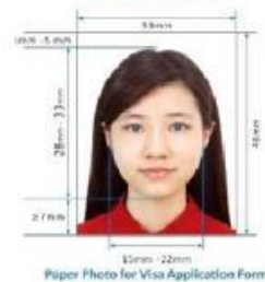
35mm x 22mm Paper Photo for Visa Application Form