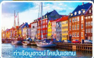
ท่าเรือฮาวน์ โคเปนเฮเกน