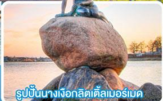
รูปปั้นนางเงือกลิตเติลมอร์เบค