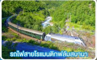
รถไฟสายโรแมนติกฟลัมสบานา