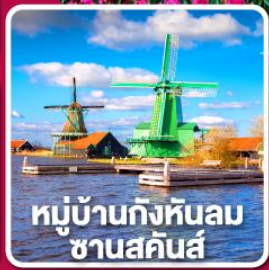
หมู่บ้านกังหันลม ซานสคินส์

เข้าชมเทศกาล สวนดอกไม้เคอเคนฮอฟ 1 ปีมีครั้งเดียว