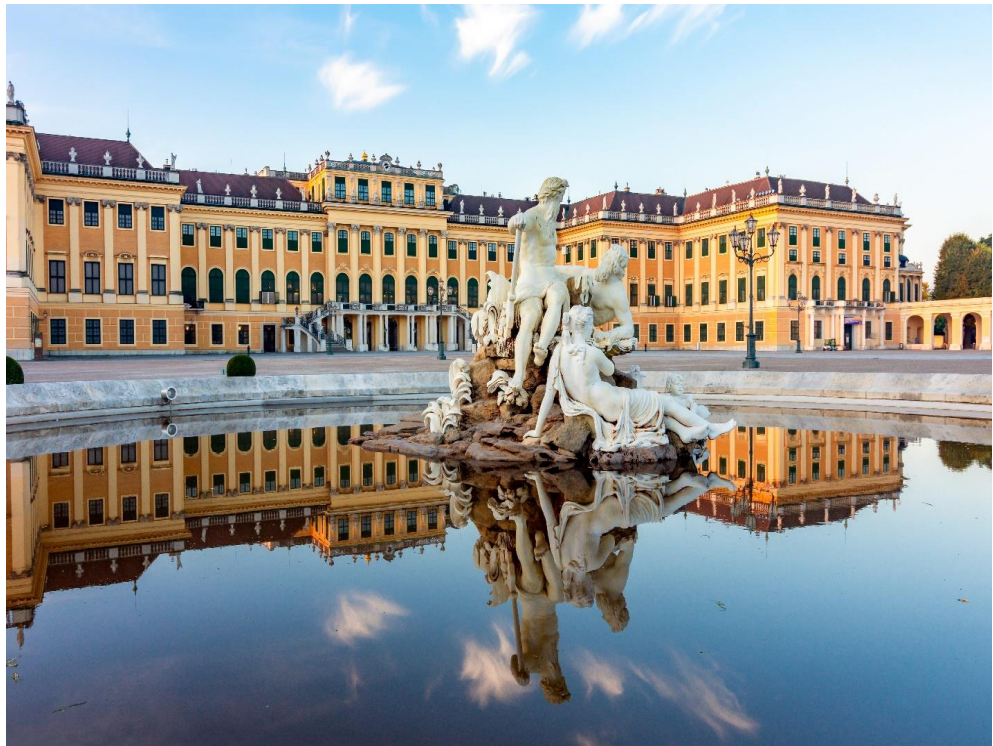
นำเข้าชมความงดงามของพระราชวังเชินบรุนน์ (SCHOENBRUNN PALACE) แห่งราชวงศ์ฮับสบูร์ก ซึ่งมีประวัติการสร้างมาตั้งแต่กลางคริสต์ศตวรรษที่ 16 และต่อมาพระนางมาเรีย เทเรซ่า ให้สร้างขึ้นใหม่อย่างสง่างามด้วยจำนวนห้องถึง 1,441 ห้องในระหว่างปีค.ศ.1744-1749 เพื่อใช้เป็นพระราชวังฤดูร้อน ชมความโอ่อ่าของท้องพระโรงและพลับพลาที่ประทับ ซึ่งได้รับการตกแต่งอย่างวิจิตรบรรจงสวยงามไม่แพ้