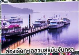
ล่องเรือทะเลสาบสุริยันจันทราร