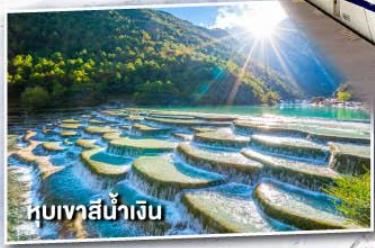
หุบเขาสีน้ำเงิน