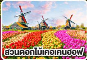
สวนดอกไม้เคอเคนฮอฟ

ดอกไม้ที่สดใส กับ หัวใจที่เบิกบาน ฝรั่งเศส เบลเยียม ลักเซมเบิร์ก เยอรมนี เนเธอร์แลนด์ 8 วัน 6 คืน