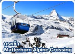
กระเช้า Matterhorn Alpine Crossing