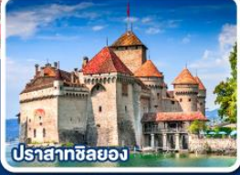
ปราสาทซิลยง