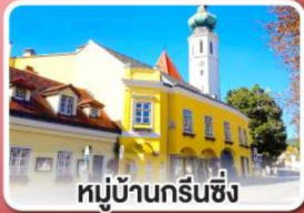
หมู่บ้านกรีนซิง