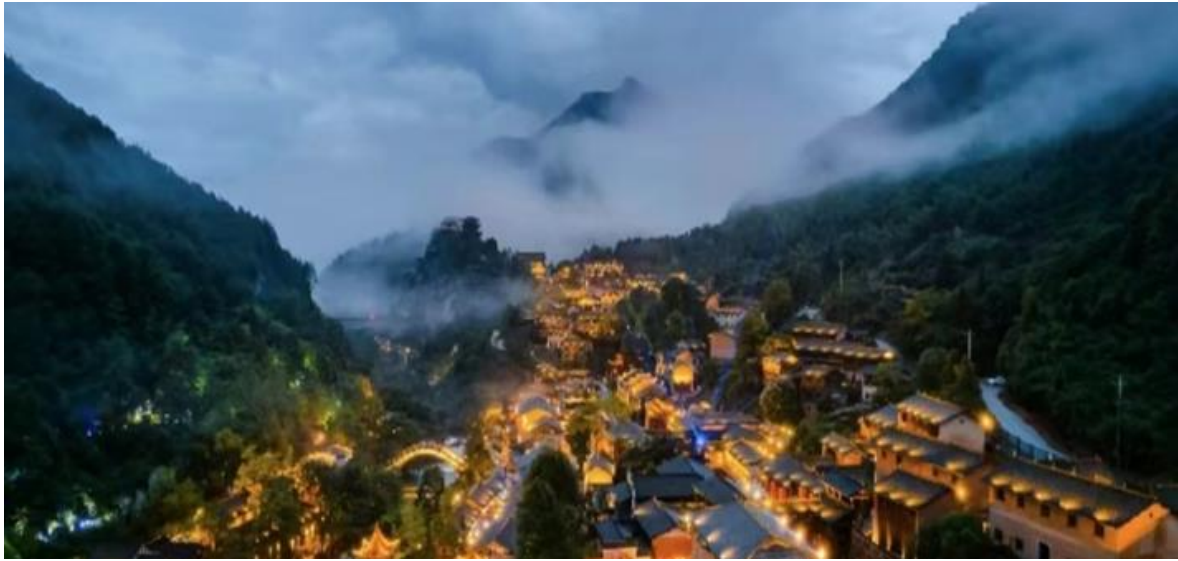
ที่พัก SHANGRAO NEW CENTURY GUANTANG HOTEL หรือเทียบเท่า 5 ดาว (มาตรฐานจีน)