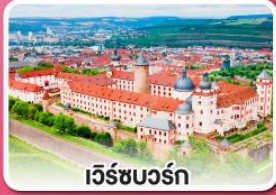
เว็รชบวร์ค