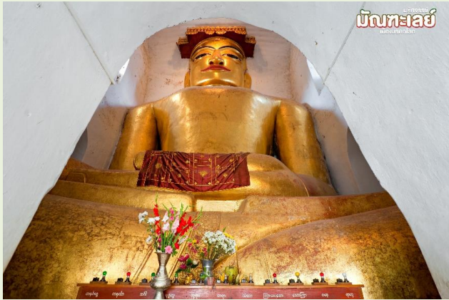
มัณฑะเลย์

จากนั้น พาท่านชม วัดมनुหา (Manuha Temple) ตั้งอยู่ทางตอนใต้ของหมู่บ้านมยินกะบา สร้างเมื่อปี 1059 โดยพระเจ้ามनुหะกษัตริย์แห่งมอญ เพื่อส่งสมัญญไว้สำหรับชาติหน้า จึงได้นำอัญมณีบางส่วนไปขายนมาสร้างวัดนี้โครงสร้างวิหารค่อนข้างแคบ มีพระนอนหนึ่งองค์ กับ พระพุทธรูปอีกสามองค์ นั่งเบียดเสียดอยู่ภายใน สะท้อนถึงความคับแค้นพระทัยของกษัตริย์เชลยพระองค์นี้เป็นอย่างดี